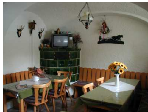
Fernsehraum mit Sat-Anschluß.